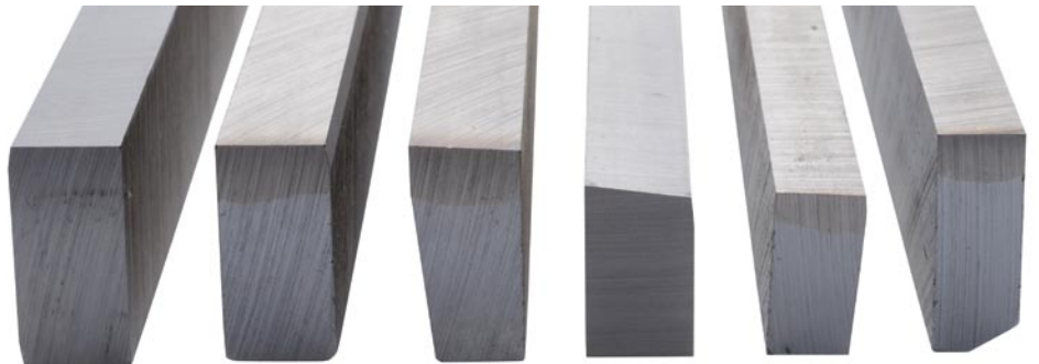
Seiherstäbe im Profil